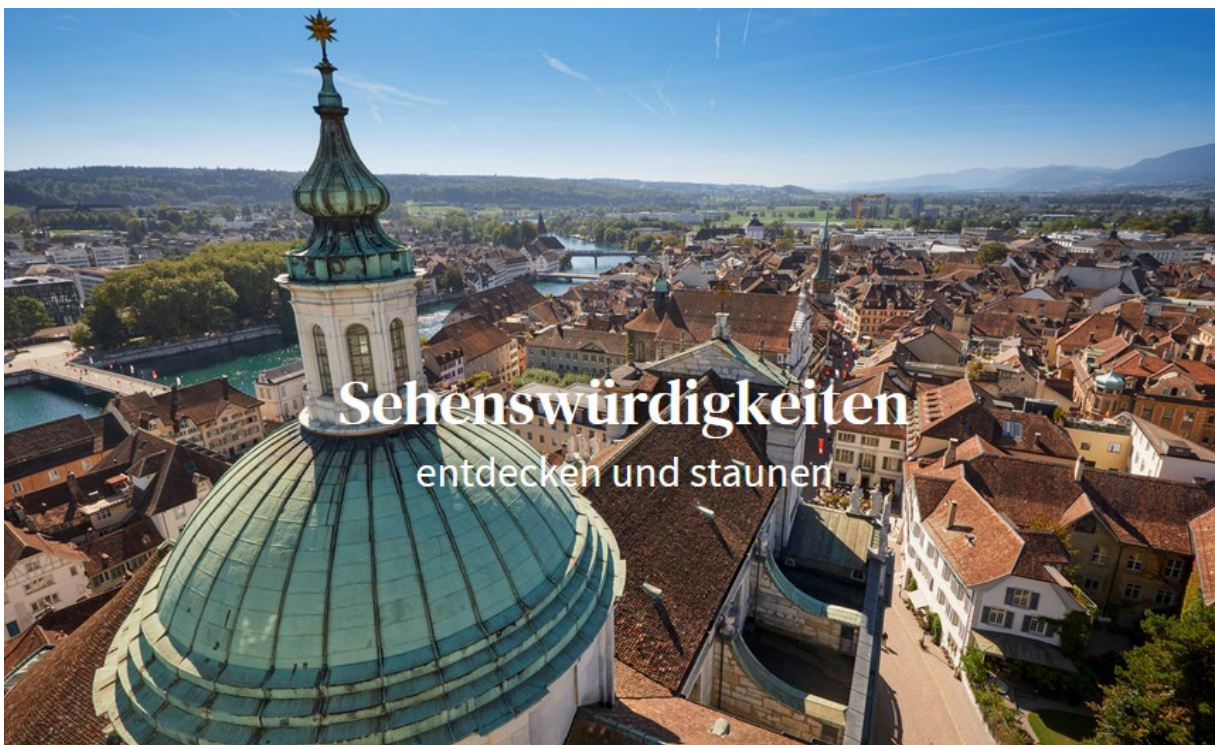
Blick vom Turm

Die Genossenschaft Kreuz in der Kreuzgasse 4, ist vom Bahnhof aus in ca. 10 min zu Fuss zu erreichen. www.kreuz-solothurn.ch/2015/06/10/wo-sind-wir/